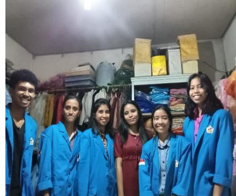
Gambar 9-10 Dokumentasi bersama pemilik butik.