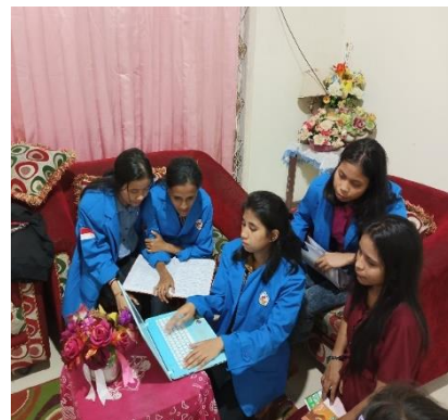
Gambar 1- 2 Penjelasan mengenai CEA dan Pengimputan data Manual ke CEA

Penyusunan laporan keuangan menggunakan CEA menggunakan informasi transaksi pada bulan Agustus 2023. Tim mulai menjelaskan setiap fungsi menu yang ada pada aplikasi CEA