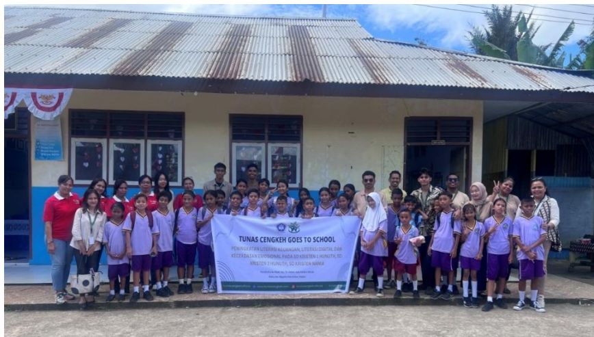
Gambar 1. Pelaksanaan Kegiatan Pengabdian Bersama Siswa di Sekolah

Secara keseluruhan, hasil kegiatan menunjukkan bahwa penerapan pendekatan edukatif dan interaktif dalam program pengabdian masyarakat mampu memberikan dampak signifikan terhadap peningkatan literasi dasar siswa. Temuan ini menegaskan pentingnya inovasi dalam metode pembelajaran yang tidak hanya berorientasi pada aspek kognitif, tetapi juga pada pengembangan keterampilan hidup yang relevan dengan kebutuhan masa depan. Oleh karena itu, program serupa perlu terus dikembangkan dan disesuaikan dengan karakteristik serta kebutuhan peserta didik di berbagai lingkungan sekolah.