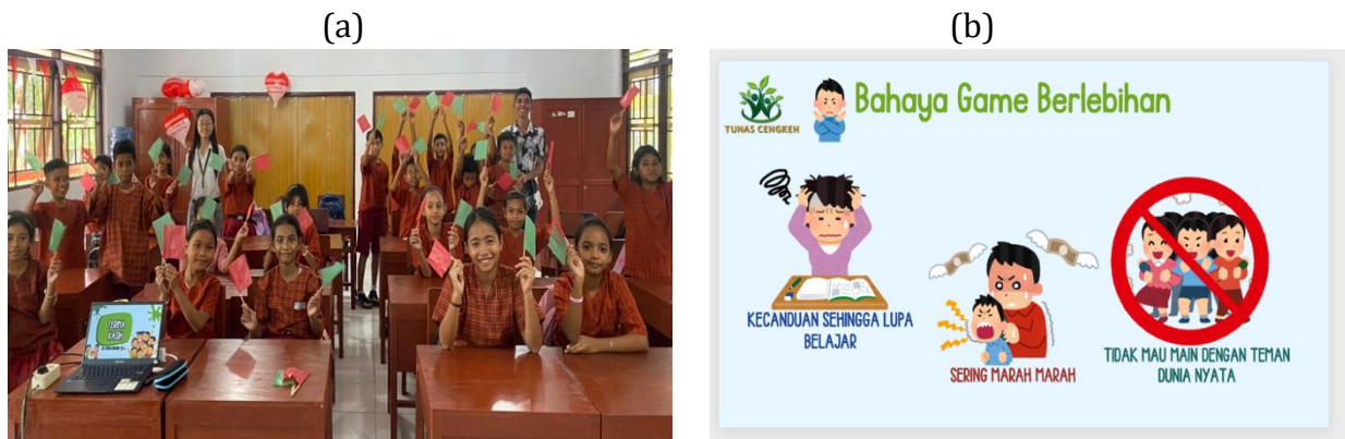
Gambar 3. Literasi Digital (a) Interaksi dengan siswa (b) Edukasi