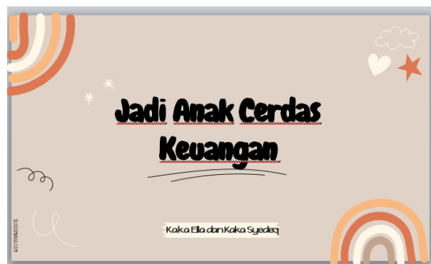
Gambar 2. Literasi Keuangan (a) Praktik (b) Materi