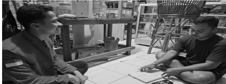
Gambar 2. Proses wawancara bersama pemilik UMKM

Hasil wawancara menunjukkan bahwa mitra belum memiliki pemahaman yang memadai mengenai literasi keuangan khususnya terkait pencatatan transaksi, penjurnalan serta pengelolaan arus kas. Mitra juga belum pernah menggunakan aplikasi akuntansi digital dan cenderung menganggap penggunaan teknologi tersebut sulit untuk dipahami.