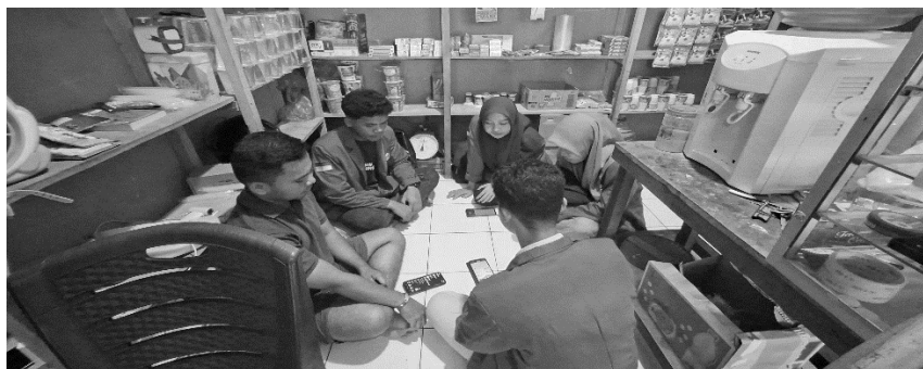
Gambar 3. Proses edukasi bersama pemilik UMKM

Lebih lanjut, mitra diperkenalkan dengan penggunaan aplikasi akuntansi digital sebagai alat bantu pencatatan transaksi. Mitra juga diberikan pemahaman mengenai perhitungan penyusutan aset tetap menggunakan metode garis lurus sebagai bagian dari pengenalan konsep akuntansi yang lebih komprehensif.