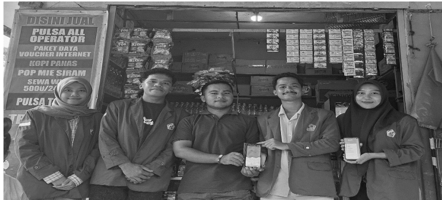
Gambar 5. Penerapan aplikasi akuntansi digital

Hasil kegiatan menunjukkan adanya perubahan pada aspek sikap (afektif), yaitu meningkatkan kesadaran dan komitmen mitra dalam melakukan pencatatan keuangan secara rutin dan terstruktur. Selain itu, mitra telah mampu melakukan penjurnalan transaksi secara mandiri menggunakan aplikasi, meskipun masih dalam tahap adaptasi dalam penggunaan teknologi.