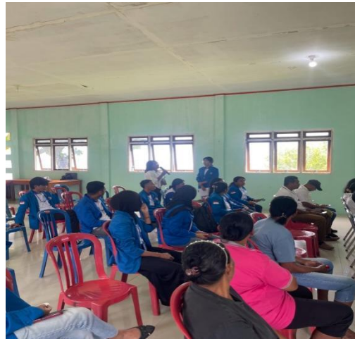
Gambar 2. Sesi Tanya Jawab