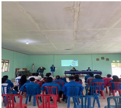
Gambar 1. Penyuluhan Marketing Digital

Kegiatan diawali dengan penyampaian materi mengenai konsep digital marketing, pentingnya transformasi digital bagi pelaku usaha, serta pengenalan platform digital seperti media sosial dan Google Maps. Pada tahap ini, peserta menunjukkan rasa antusias yang tinggi dalam mengikuti materi yang disampaikan. Hal ini terlihat dari perhatian peserta selama kegiatan berlangsung serta keterlibatan mereka dalam diskusi yang dilakukan.